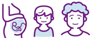
Mère - Enfant